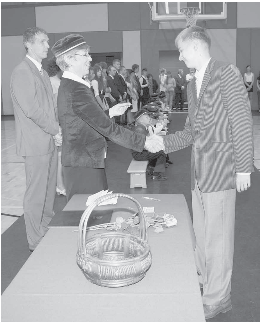
Kooliaasta avaaktusel Väike-Maarja Gümnaasiumis.