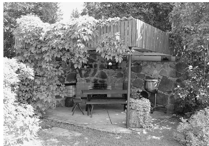
Vao külas avaldas muljet Hausi pere koduaed omanäoliste puhkenurkadega.