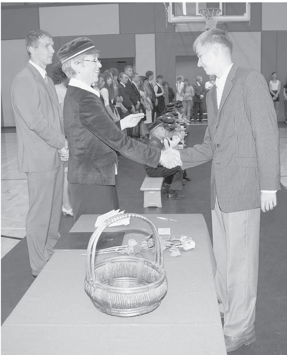
Kooliaasta avaaktusel Väike-Maarja Gümnaasiumis.