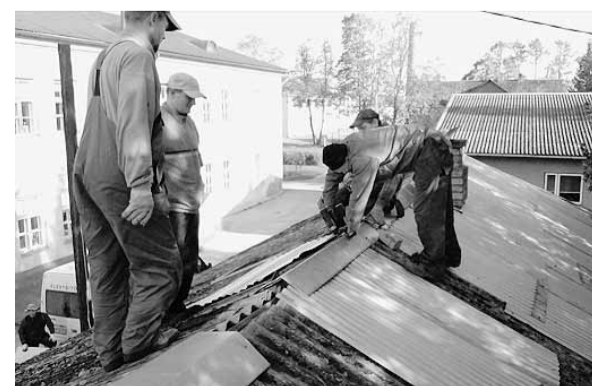
Talgulised katust parandamas.