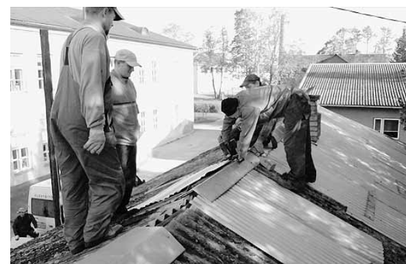
Talgulised katust parandamas.