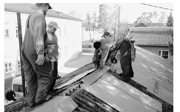
Talgulised katust parandamas.