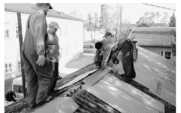
Talgulised katust parandamas.