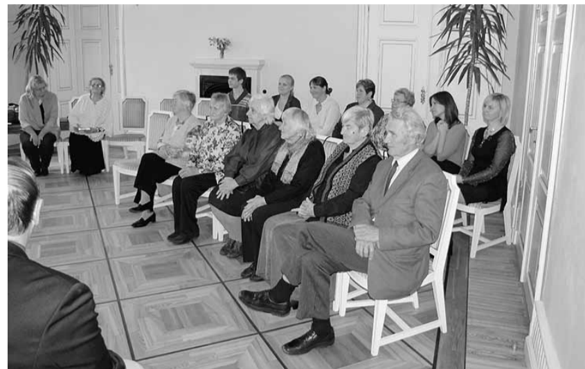
Hetk õpetajapäeva tähistamisest Kiltsi põhikoolis.