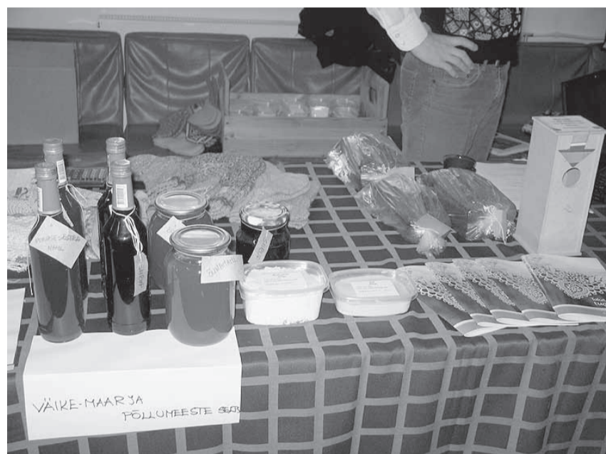
Pilk Väike-Maarja Põllumeeste Seltsi messiväljapanekule

tete üle, kes oma tegevusega pakuvad tööd ja loovad siinsetele inimestele töökohti. Toomas Uudeberg rõõmustas