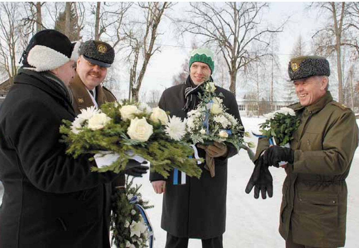
Hetk enne lillede asetamist Väike-Maarja Vabadussamba jalamile

Üheks probleemiks, mille parendamiseks saame kõik mingil määral ka ise kaasa aidata, on turvalisus. Eelmise aasta lõpul ja selle aasta alguses on mõnedel ettevõtetel ja eraisikutel käinud „külmas“ öised vargad. Nad on garaazidest või laohoonetest tassunud minema vähegi väärtust omavat kraami. Siinkohal kutsun kõiki üles kahtlast tegevust nähes ise huvi tundma ja sellise tegevuse peatama või sellest siis konstaablitele teada andma. Eks me kõik saame rahulikult elada, kui õitseid pahatahtlikke „külalisi“ vähemaks jääb.