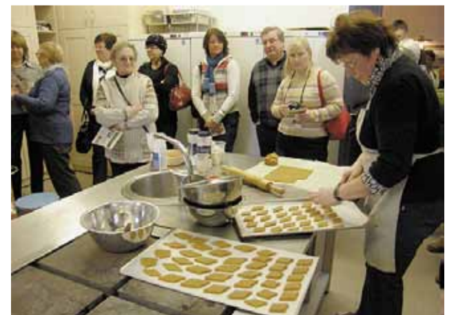
Avinurme elulaadikeskuses