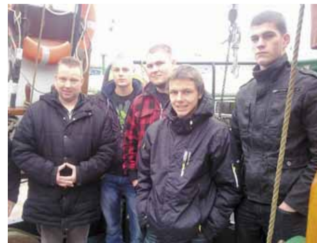
Autotehnikud Leeris praktilal.