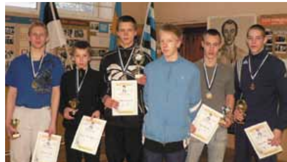
Väike-Maarja maadlejad Avo Talpase mälestusvõistlustel