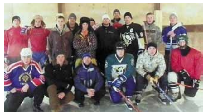
Võistlejad enne hokilahingute algust

Palju tänu toetajatele: A. Le Coq, Klaasmerk.