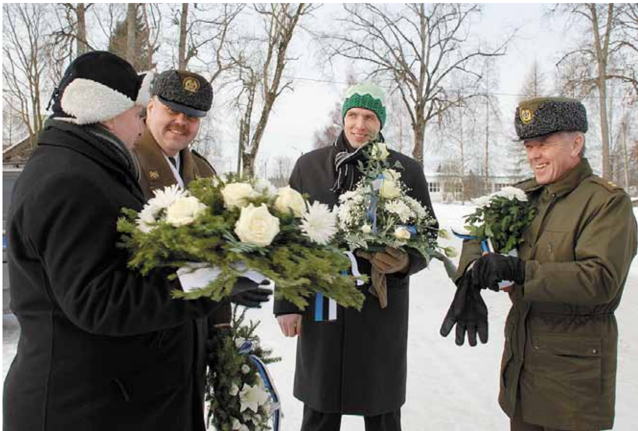
Hetk enne lillede asetamist Väike-Maarja Vabadussamba jalamile

Üheks probleemiks, mille parendamisele saame kõik mingil määral ka ise kaasa aidata, on turvalisus. Eelmise aasta lõpul ja selle aasta alguses on mõnedel ettevõtetel ja eraisikutel käinud „külmas“ öised vargad. Nad on garaazidest või laohoonetest tassunud minema vähegi väärtust omavat kraami. Siinkohal kutsun kõiki üles kahtlast tegevust nähes ise huvi tundma ja sellise tegevuse peatama või sellest siis konstaablitele teada andma. Eks me kõik saame rahulikult elada, kui õitseid pahatahtlikke „külalisi“ vähemaks jääb. Me võime olla õnnelikud, Lääne-Vi-