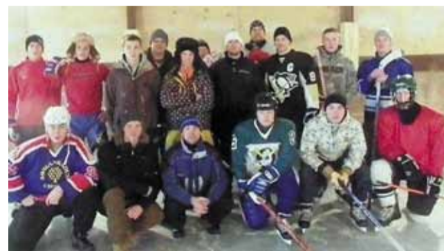
Võistlejad enne hokilahingute algust

Palju tänu toetajatele: A. Le Coq, Klaasmerk.