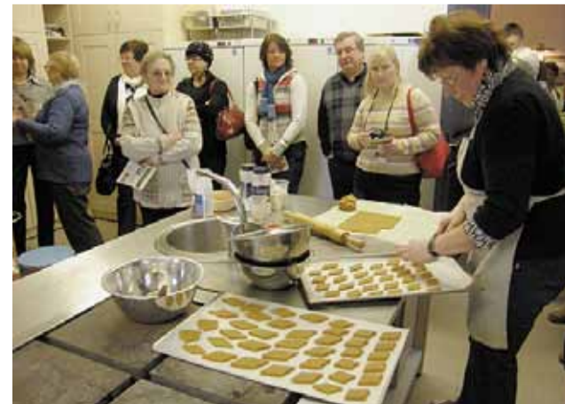
Avinurme elulaadikeskuses