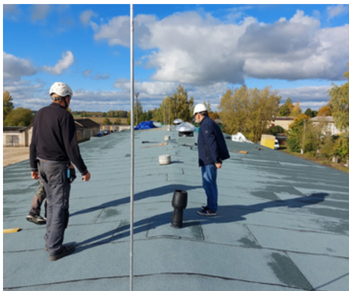
Väike-Maarjas Tehno tn 2 asuva töökojahoone rekonstrueeriti katuse.

■ Seltsimaja saali uue ekraani ja projektori paigaldamine. Töid teostas Datel AS.