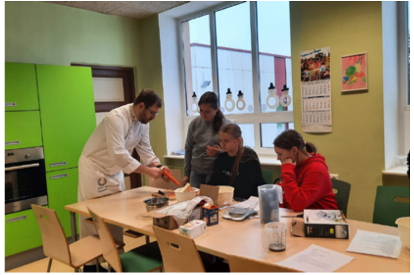
Rakke õpilased tegid süüa peakoka juhendamisel.