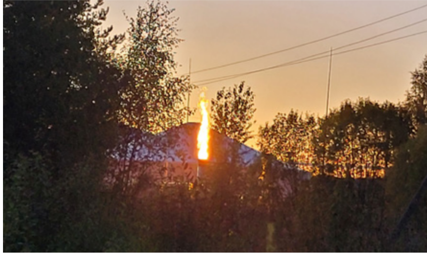
Biometaanitehase põletist paistev lahtine leek paneb inimesi häirekeskusesse helistama.

Koort kinnitas, et biogaasijaama käivitamisel käis päästeamet jaamaga tutvumas. Hilisemate väljakutsete korral pole ohtu kellegi olnud, kuid iseenesest on tehases muidugi kasutusel ka automaatne tulekustutussüsteem,