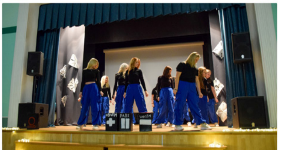
Fotokollaaž jõulueelsest viimasest koolipäevast Simuna koolis.

lapsed testida, kui korralikult nad oma hambaid harjavad.