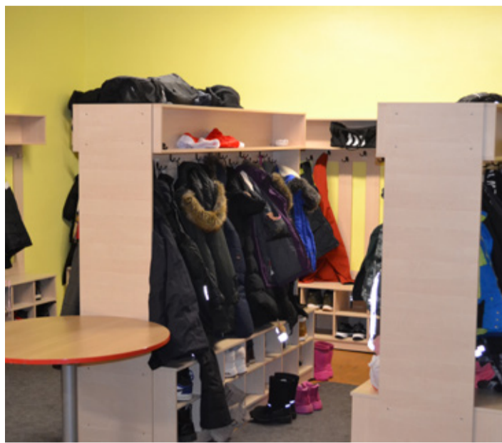
Simuna kooli soetatud uued garderoobikapid.