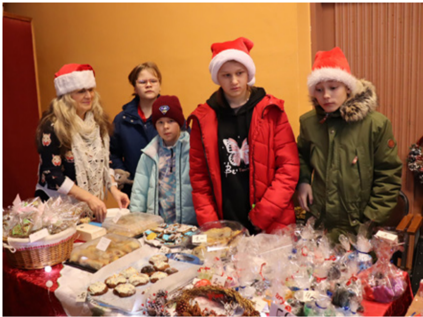
Õpilased olid laadal väljas esinduslike müügiletidega.