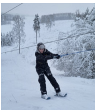
Rakke Linnamäel katsetatakse suusatõstuki. Sel talvel tõstuk veel igapäevaselt ei tööta, kuid järgmiseks hooajaks loodetakse see elektri püüsiühendusega toimima saada.

Rakke linnamäe terviseradadel on talveperioodiks suusaraja valgustuse lülituseks uus telefoninumber. Number on leitav radade alguses infotahvil. Valgustus süttib tunniks, kui helistada infotahvil olevale numbrile. Lisaks on spordiklubi Rakke vahenditest soetatud suusaradade hoolduseks ka võimsam ja uuem mootorkelk. Kohati jääb uuem masin