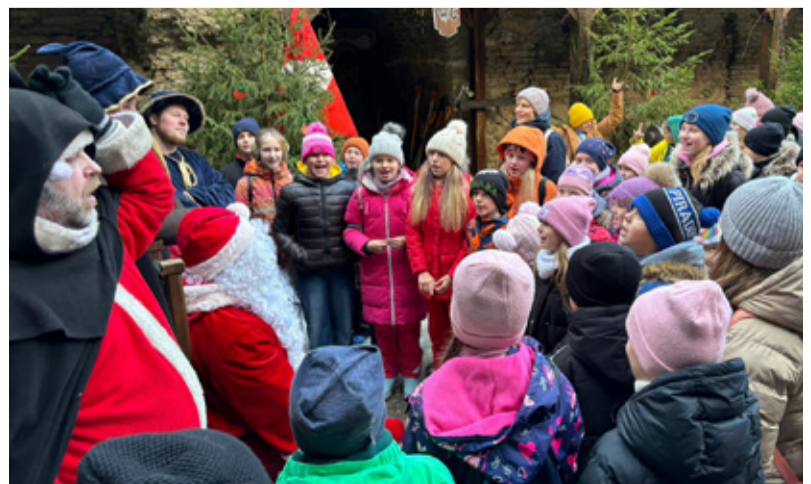
Rakke kooliõpilased kohtusid Rakvere linnuses jõuluvana.