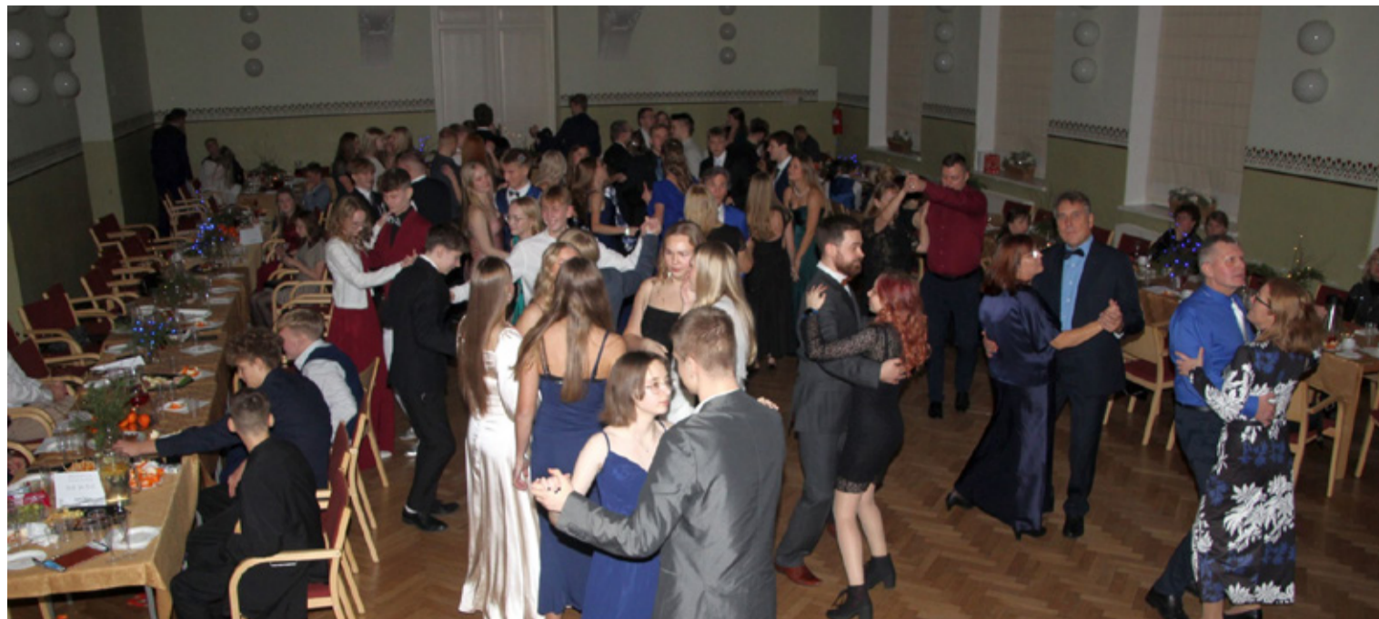
9.–12. klasside jõuluballe on Väike-Maarjas korraldatud juba üle 20 aasta.

11. klassi õpilane Väike-Maarja gümnaasium