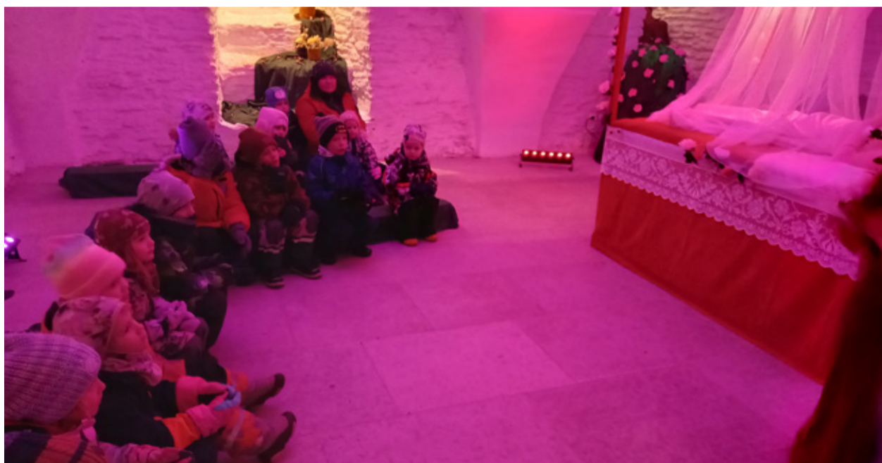
Lasteaiastel õnnestus Okasroosike äratada.

Igal aastal käib Kiltsi lasteaiarändurite rühm kusagil jõulumaal. Sel aasta oli mitu jõulumaad kaalumisel, kuid otsustasime Rakvere linnuse jõulumaad kasuks. Küllastuse plaanisime 10. detsembriks. Kõik rühma lapsed osalesid. Linnuse väravas ootas meid sõjapäkapikk, kes tutvustas meile teisi päkapikke. Alustuseks tegi ta väikese kahuriga pauku. Peale seda suundusime kaasa muinasjutumemmega, kes jutustas muinasjuttu Okasroosikesest. Tore oli, et ta kaasas jutustamiseks ka lapsi. Lapsed pidid märguande peale õigel ajal tegema kokkulepitud hääliitsusi. Lõpuks lapsed saatsid õhumusi ja Okasroosike ärkaski unest. Muinasjutt kuulatud, läksime võlurite ruumi, kus lapsed said teada võlumise kunstist ja pärast kaasa oma võlutud kuldkuuli. Siis kutsusid magusa- ja meisterdamise päkapikud enda juurde. Lapsed meisterdasid vahukommidest lumememme, mille said kuuma tee kõrvale ära süüa, ning puulitri peale kleepida kaunistusi. Edasi viis sõjapäkapikk meid nõia äratamise kambris. See koht oli las-