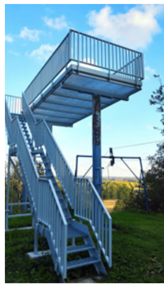
Rakkes renoveeriti Linnamäe vaatetorn.

■ Kase pargis liigvee ärajuhtimiseks truubi paigalda-