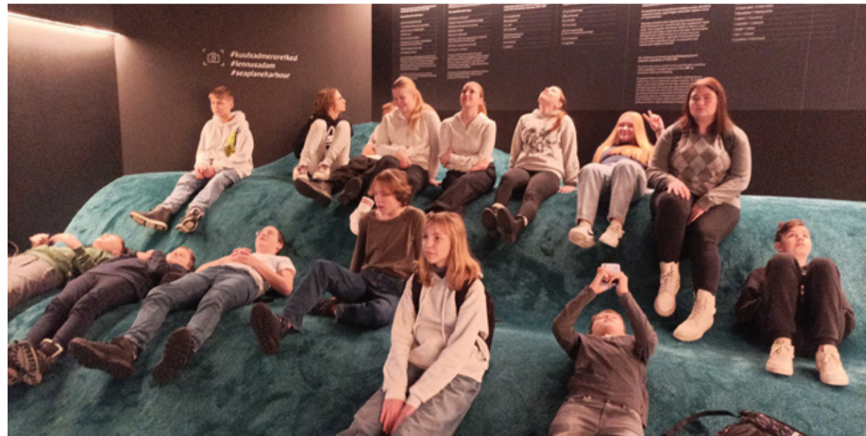
Positiivsete õpitulemustega õpilased käisid Lennusadamal.